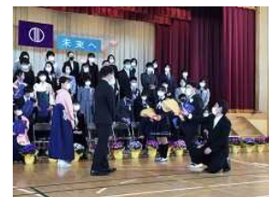
昨年の卒業式の様子から