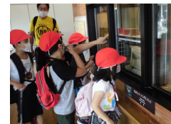
1年八木山動物園見学を楽しみました