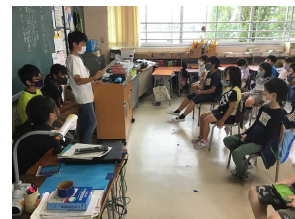
6年生はたてわり活動のリーダーです